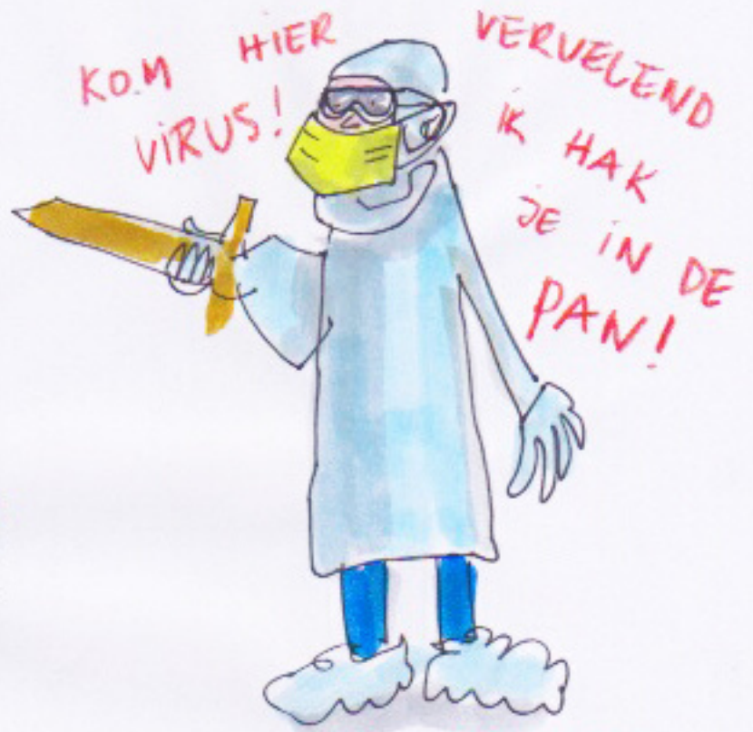
DE DAPPERE CORONARIDDER

VIRUS : NIET ZICHTBAAR MET HET BLOTE OOG. HEEEEEEEL KLEIN DUS. KLEINER DAN HET ALLERKLEINSTE TER WERELD WAT JE BEDENKEN KAN.